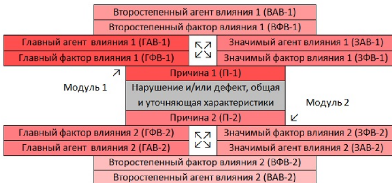
Схема 2. Модульная модель анализа причин ухудшения качества медицинской помощи (двухмодульный вариант)

Условия корректного использования «Модульной модели» те же, что и для «Концентрической», с той разницей, что каждый подключаемый «модуль» будет иметь свою «линейку» баллов. При этом, «линейка» баллов каждого «модуля» будет отличаться на единицу от «линейки» соседнего и, соответственно, следует заранее установить предельное количество «подключаемых» причин («модулей»), чтобы значимость причины и всего состава соответствующего «модуля» отражалась в результатах. Например, для «Модуля 1» (сокращения на примере схемы 2): П-1, ГАВ-1 и ГФВ-1 – 4 балла, ЗАВ-1 и ЗФВ-1 – 3 балла, ВАВ-1 и ВФВ-1 – 2 балла; для «Модуля 2» П-2, ГАВ-2 и ГФВ-2 – 3 балла, ЗАВ-2 и ЗФВ-2 – 2 балла, ВАВ-2 и ВФВ-2 – 1 балл.