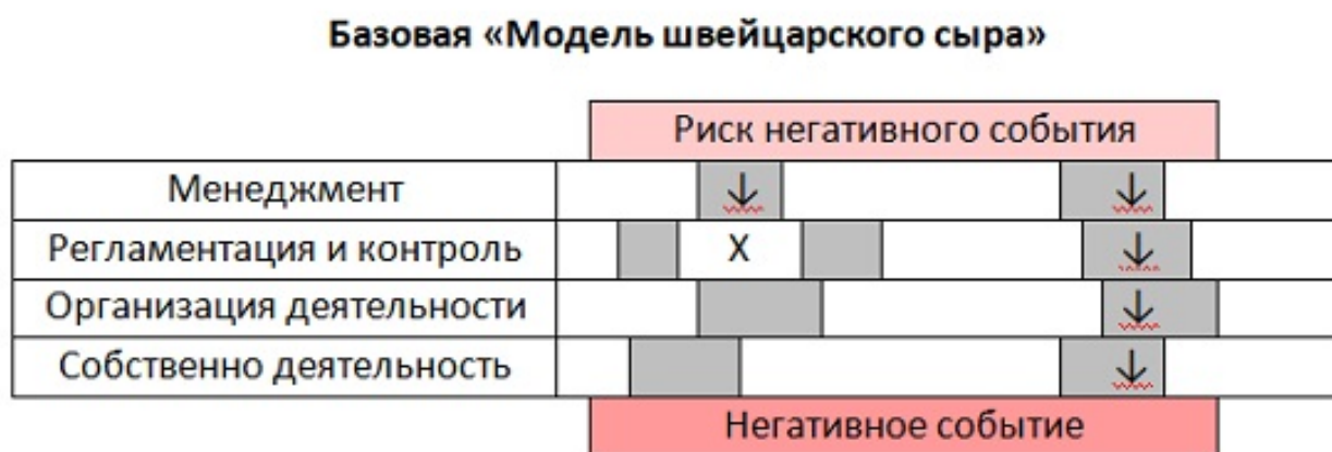
Схема 4. Модель «Швейцарского сыра» в классическом варианте

Анализ «дырок» в каждом «ломтике» позволяет уменьшить их количество за счёт устранения их части и сузить те из них, полная ликвидация которых в настоящее время невозможна по каким-либо причинам. Ещё один важный момент: внутри каждой категории можно выделить отдельные области и их дополнительно проработать, создав новые барьеры на пути