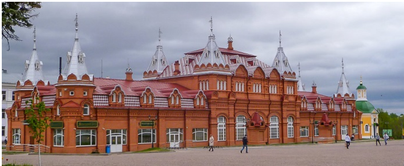
Вид из окон конференц-зала Паломнического центра: